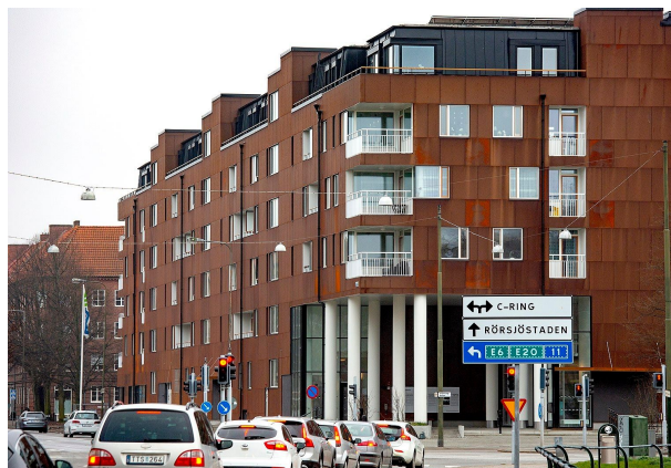
Kv Sofia i Malmö