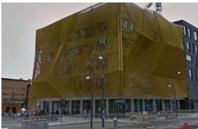
Spektrum i Nya Hovås, Göteborg