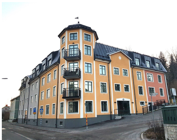
Brf Sparven

Omröstningen om finaste svenska nyproduktion vanns av Brf Sparven i Norrtälje, ritat av Pian Klinth från Sweco Arkitekter som fick ta emot diplom och berätta om projektet.