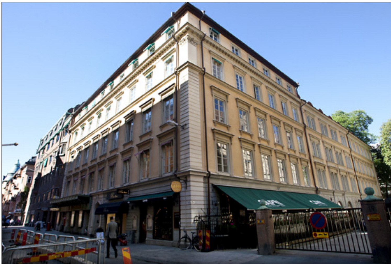
Högra delen av huset ska rivras. I stället byggs ett modernt kontorshus med ett tak som även täcker huset mot Nybrogatan. Taket blir 4 meter högre än den del som rivs. Boende på Nybrogatan har protesterat.